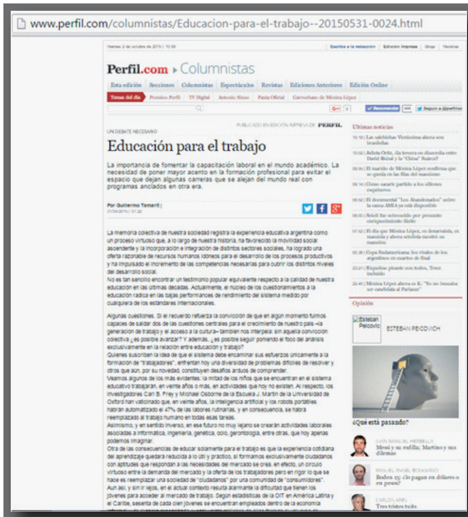
Captura de pantalla del texto en su versión original

Por Guillermo Tamarit Rector de la Universidad Nacional del Noroeste de la Provincia de Buenos Aires 31/05/2015 | 01:22