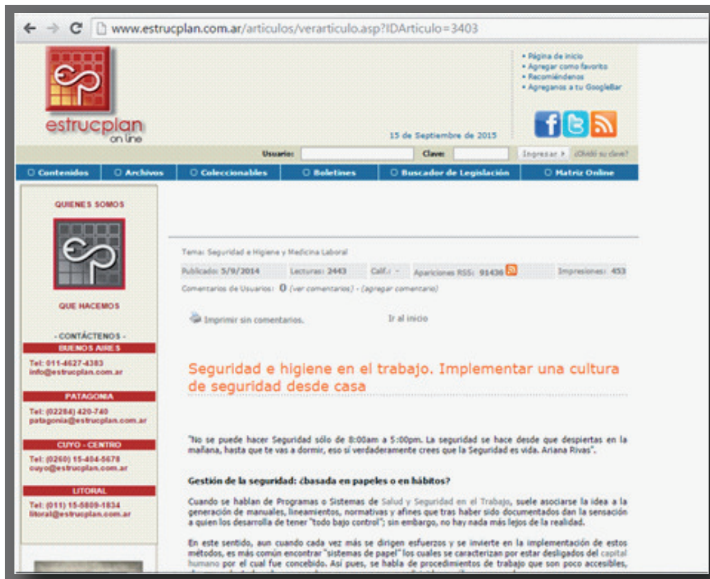
Captura de pantalla del texto en su versión original