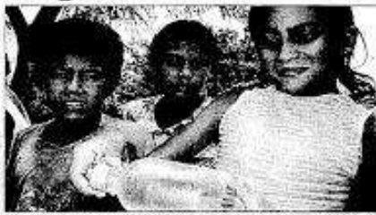
Sucia. En el sector el agua está saliendo sucia, se quedó una vecina del sector 8 y mostró una botanilla con el agua turbia y con pequeños animalitos.

Cuando llegó el agua a los caños, salió sucia y turbia, y al dejaba que se asiente, observaron unos animalitos que se movían